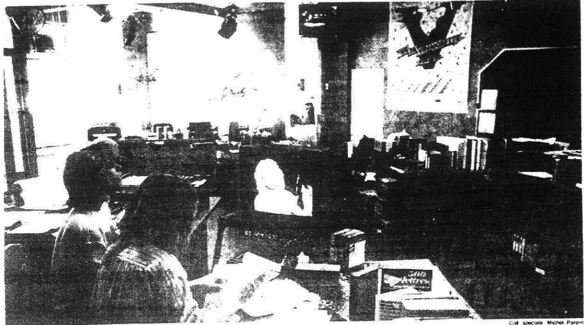
Les animateurs de Musique Plus n'occupent pas un studio traditionnel. Ils travaillent à la bonne franquette dans une pièce qui sert aussi de bureau de travail à toute l'équipe.

Mais le projet numéro un de Musique Plus c'est bien sûr d'en arriver à diffuser 24 heures sur 24. Une demande en ce sens a été faite